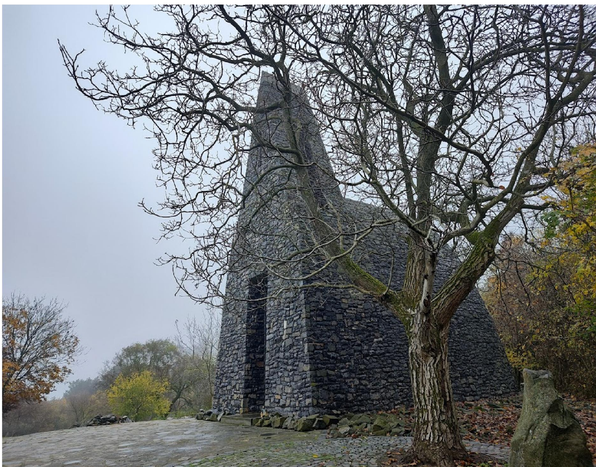
Kaple Istvan Kiraly